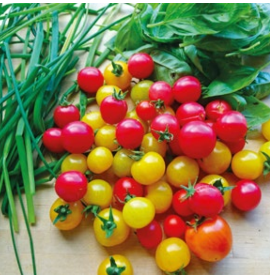
En flott og bugnende avling

Hagelagsstyret vil også rette en stor takk til ildsjelene som hjalp beboere som var på ferie med å holde plantene i live gjennom sommeren.