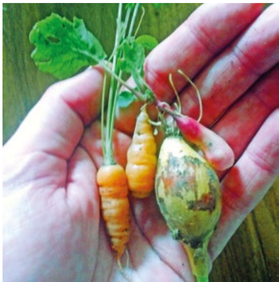
Små, men smakfulle grønnsaker.